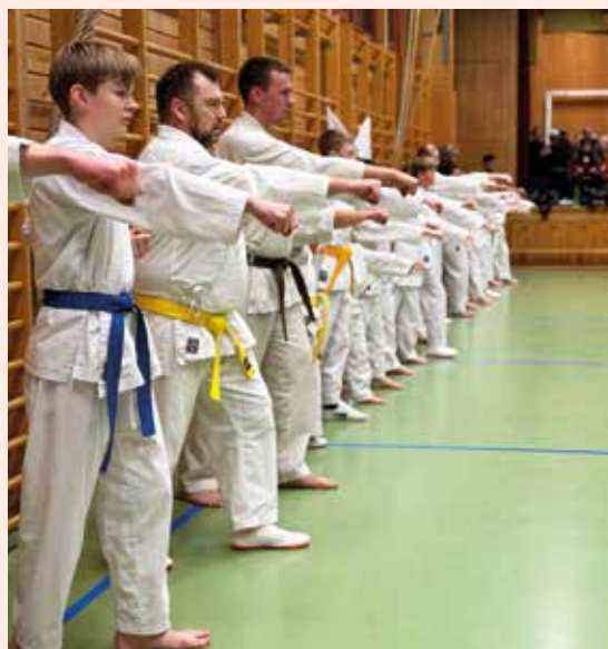
Layout: Veleum.no, 2026. Trykk: Merkur Grafisk AS. Opplag: 300